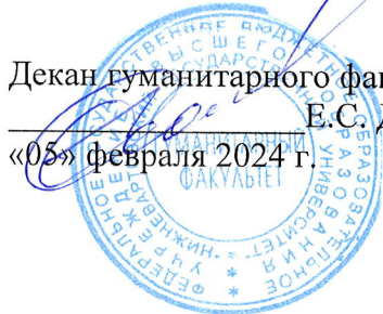
График проведения первой повторной промежуточной аттестации и индивидуальных консультаций по дисциплинам

на период с 05 февраля 2024 по 10 июня 2024 года