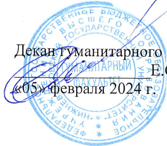
График проведения первой повторной промежуточной аттестации и индивидуальных консультаций по дисциплинам

на период с 05 февраля 2024 по 10 июня 2024 года