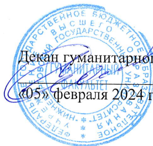
График проведения первой повторной промежуточной аттестации и индивидуальных консультаций по дисциплинам