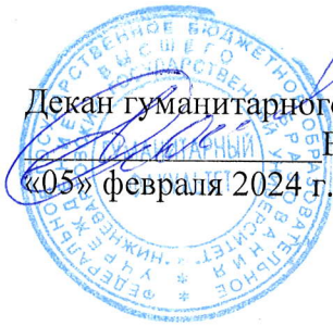
График проведения первой повторной промежуточной аттестации и индивидуальных консультаций по дисциплинам