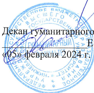
График проведения первой повторной промежуточной аттестации и индивидуальных консультаций по дисциплинам