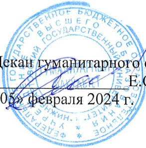
График проведения первой повторной промежуточной аттестации и индивидуальных консультаций по дисциплинам