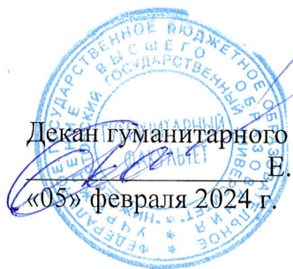
График проведения первой повторной промежуточной аттестации и индивидуальных консультаций по дисциплинам

на период с 05 февраля 2024 по 10 июня 2024 года