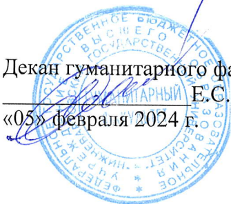
График проведения первой повторной промежуточной аттестации и индивидуальных консультаций по дисциплинам