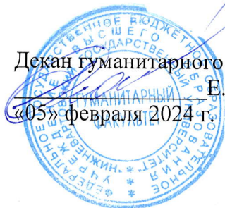
График проведения первой повторной промежуточной аттестации и индивидуальных консультаций по дисциплинам