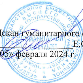
График проведения первой повторной промежуточной аттестации и индивидуальных консультаций по дисциплинам

на период с 05 февраля 2024 по 10 июня 2024 года